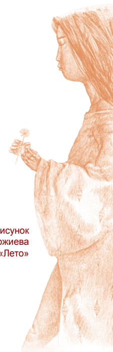
Рисунок Зорикто Доржиева «Лето»

Как преодолеть экзаменационную тревожность