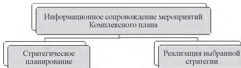
Рисунок 2 – Планирование информационного сопровождения мероприятий Комплексного плана

Основные принципы информационного сопровождения мероприятий Комплексного плана основываются на базовых принципах: